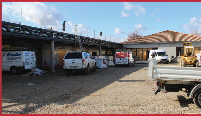
13 novembre : Le préau s'installe.