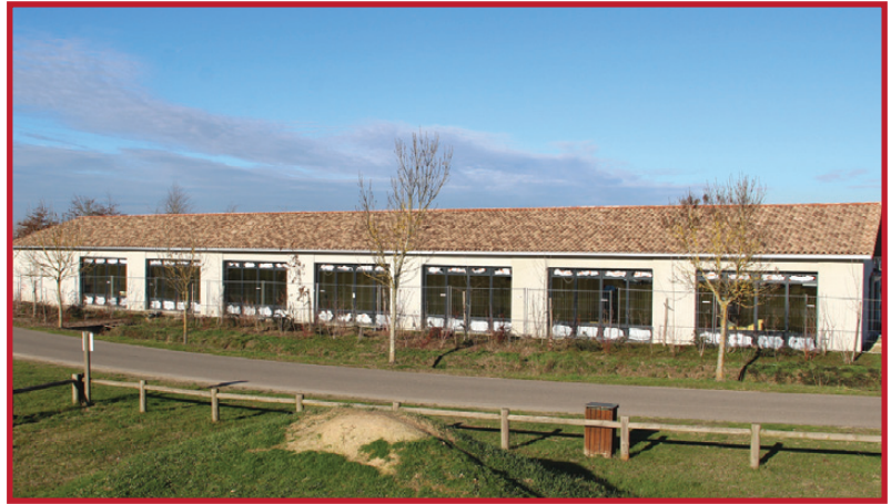
Janvier 2020 : 8 vitres = 8 classes...