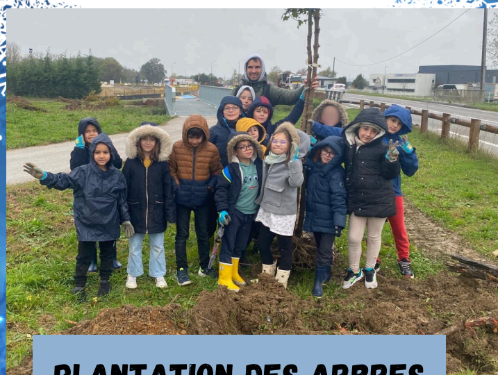
PLANTATION DES ARBRES