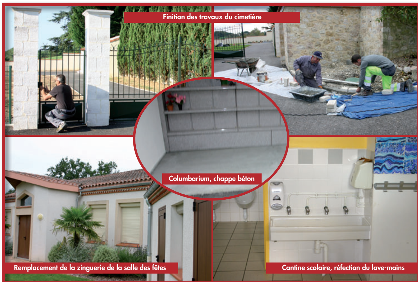
Finition des travaux du cimetière