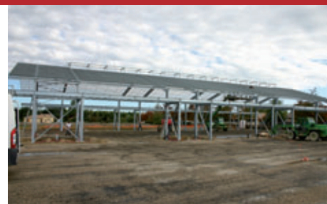
Novembre 2013, la couverture de la toiture et l'isolation phonique...