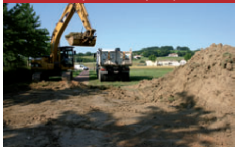
Juin 2013, premier coup de pelle...