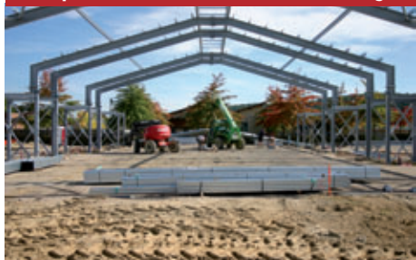
Septembre, octobre 2013, le montage de la structure...