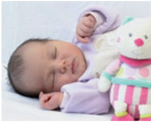
► Andréa CHANEL Le 30 août 2013 8, allée de Laspargues