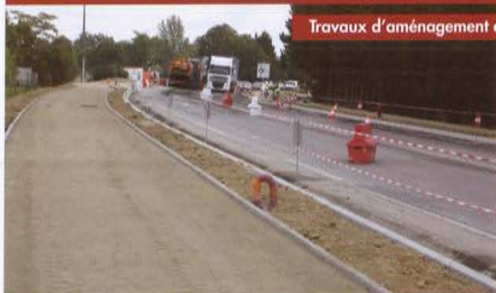
Travaux d'aménagement et sécurisation de la RD 931