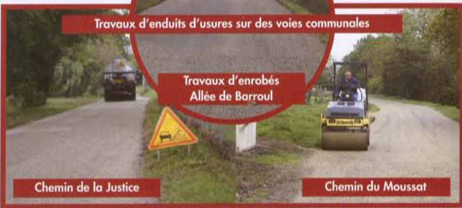
Travaux d'enrobés Allée de Barroul