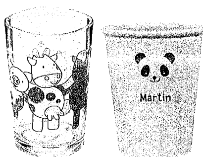
exemples de gobelets personnalisés